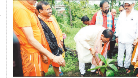
पौधरोपण करते स्वास्थ्य मंत्री।