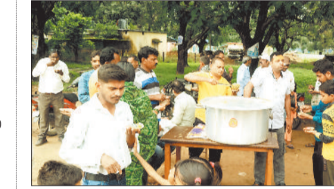
भंडारे का प्रसाद ग्रहण करते श्रद्धालु।