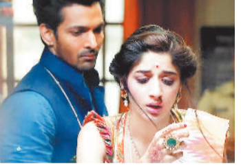
सनम तेरी कसम: यह फिल्म एक शर्मिली और पारंपरिक लड़की सरस्वती और एक गलत समझे गए विद्वेही को दिल तोड़ने वाली प्रेम कहानी को दर्शाती है। उनकी गहरी जुड़ाव बहुत देर से खिलता है, जो एक दिनाशकरी त्रासदी में समाप्त होता है।