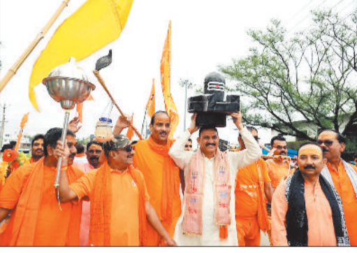
निकली कांवड़ यात्रा।