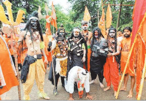
कांवड़ यात्रा को लेकर युवाओं का खासा उत्साह।