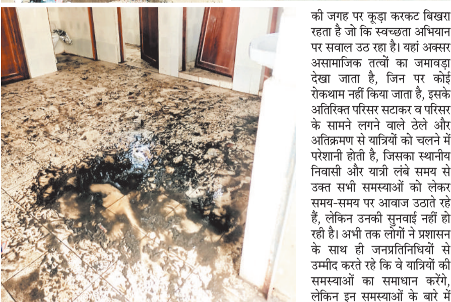
खस्ताहाल बस स्टैंड।

की जगह पर कूड़ा करकट बिखरा रहता है जो कि स्वच्छता अभियान पर सवाल उठ रहा है। यहां अक्सर असामाजिक तत्वों का जमावड़ा देखा जाता है, जिन पर कोई रोकथाम नहीं किया जाता है, इसके अतिरिक्त परिसर सटाकर व परिसर के सामने लगने वाले ढेरों और अतिक्रमण से यात्रियों को चलने में परेशानी होती है, जिसका स्थानीय निवासी और यात्री लंबे समय से उक्त सभी समस्याओं को लेकर समय-समय पर आवाज उठाते रहे हैं, लेकिन उनकी सुनवाई नहीं हो रही है। अभी तक लोगों ने प्रशासन के साथ ही जनप्रतिनिधियों से उम्मीद करते रहे कि वे यात्रियों की समस्याओं का समाधान करेंगे, लेकिन इन समस्याओं के बारे में उनकी उदासीनता से स्थिति निराशाजनक बनी हुई है।