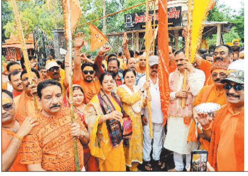
कांवड़ यात्रा का शुभारंभ करते स्वास्थ्य मंत्री, विधायक, कलेक्टर व अन्य।