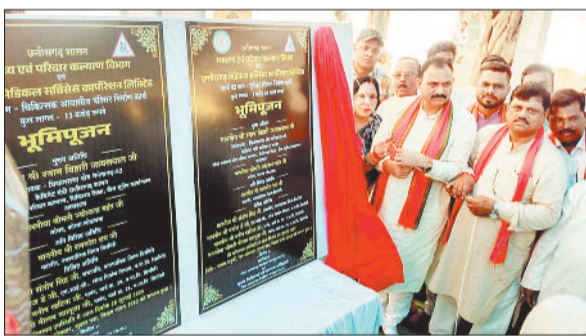
भूमिपूजन करते स्वास्थ्य मंत्री श्याम बिहारी जायसवाल।

इस अवसर पर मंत्री श्री जायसवाल ने कहा कि चिरमिरी में स्वास्थ्य सुविधाओं के लिए अकेले 100 करोड़ रूपए से अधिक की लागत से निर्माण और उपकरणों की व्यवस्था की जा रही है, जो पलायन की प्रवृत्ति पर प्रभावी अंकुश लगाएगी और चिकित्सकों को