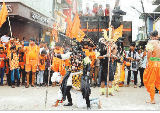
कुमार चौक में भगवान भोले की जीवंत झोंकी का प्रस्तुति देते युवा।